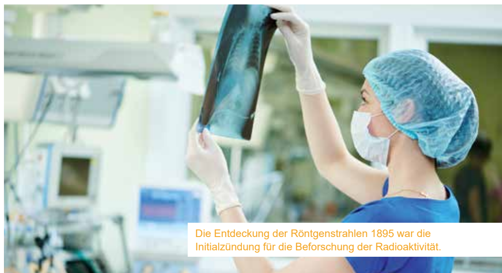
Die Entdeckung der Röntgenstrahlen 1895 war die Initialzündung für die Beforschung der Radioaktivität.

Das erste weitgehend anerkannte Atommodell stammte von Niels Bohr und wurde 1913 entwickelt. Atome bestehen in diesem Modell aus einem schweren, positiv geladenen Atomkern und leicht-