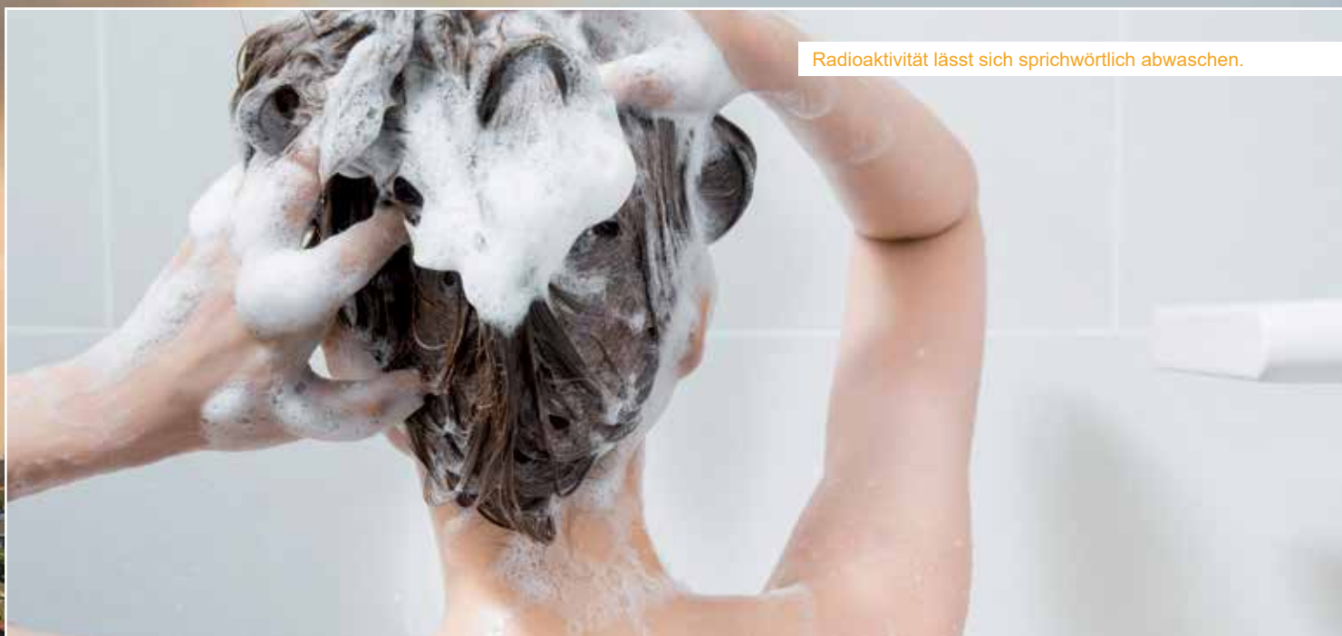
Radioaktivität lässt sich sprichwörtlich abwaschen.

Broschüre. Ebenfalls können Produkte im Webshop des Zivilschutzverbandes unter www.zivilschutzverband.at bestellt werden.