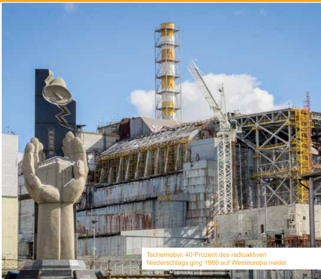
Tschernobyl: 40 Prozent des radioaktiven Niederschlags ging 1986 auf Westeuropa nieder.

Weltweit sind zwischen 40 und 60 neue Atomkraftwerke im Bau bzw. in der Planung. Wie groß die Gefahr noch immer ist, zeigen die zahlreichen Störfälle, die gemäß der Internationalen Bewertungsskala für nukleare und radiologische Ereignisse verzeichnet werden. Dabei wird auf einer Skala von 0 bis 7 der Schweregrad festgestellt. Die Liste der Unfälle, die die Stufe 4 (Radioaktives Material wurde freigesetzt, mindestens ein Toter) übersteigen, zählt seit 1980 insgesamt 10 Fälle, darunter die bekanntesten Reaktorkatastrophen 2011 in Fukushima, Japan und 1986 in Tschernobyl in der damaligen Sowjetunion. Meldepflichtige Zwischenfälle bis Stufe 4 werden aber alleine in Deutschland rund 100 pro Jahr verzeichnet oder rund 30 in der Schweiz. Die Folgen der beiden bekanntesten Katastrophen in Tschernobyl und Fukushima sind bis heute schwer